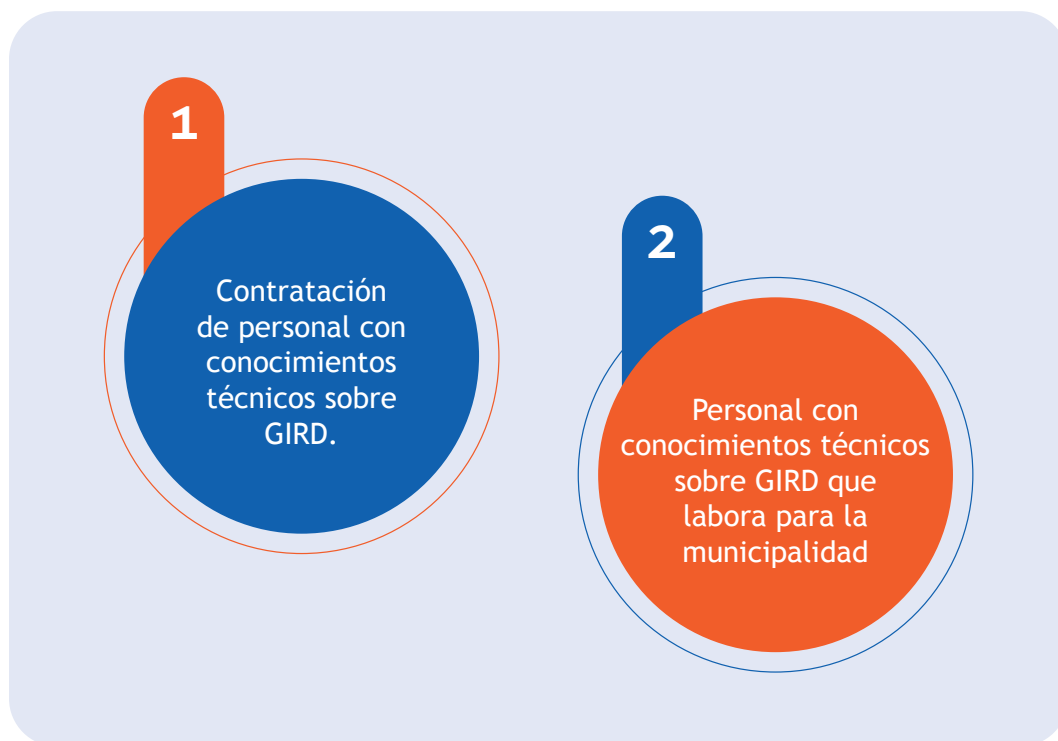
Figura 2. Tipos de contratación sugeridos para personal técnico que conformará la IMGIRD.