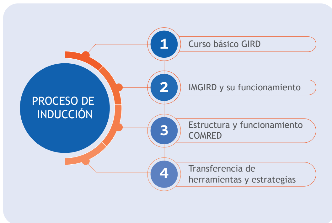
Figura 3. Proceso de inducción dirigido a IMGIRD desarrollado por la Secretaría Ejecutiva de la CONRED.

Es importante aclarar que, en función de recursos, tiempo, situaciones imprevistas o algún otro factor condicionante, este orden puede sufrir alguna modificación.