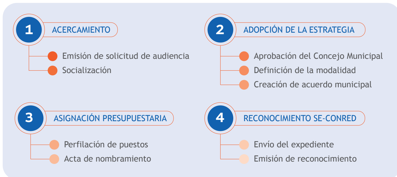
Figura 1. Procesos para la conformación de la Instancia Municipal de Gestión Integral del Riesgo de Desastres (IMGIRD).